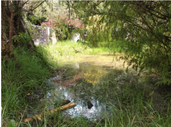
Fotografía 7. Vista Lago, alimentado por los aljibes