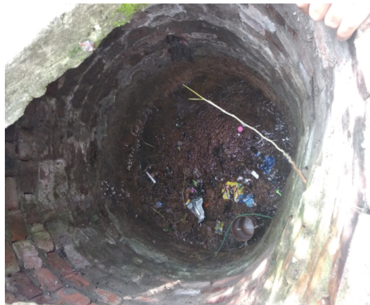
Fotografía 9. Vista exterior del aljibe aj-01-0096