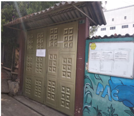
Fotografía 1. Vista general de la entrada al colegio