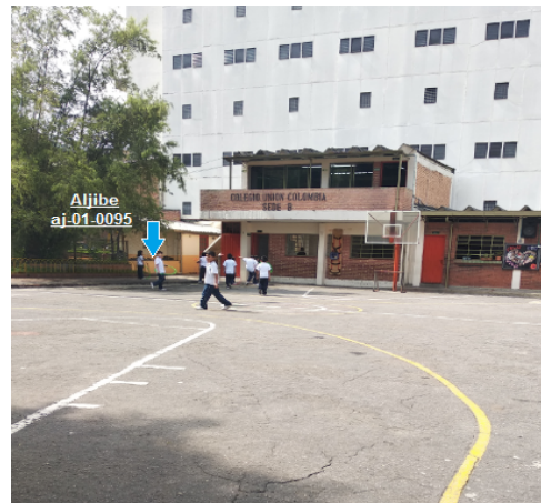
Fotografía 2. Vista ubicación aljibe aj-01-0095