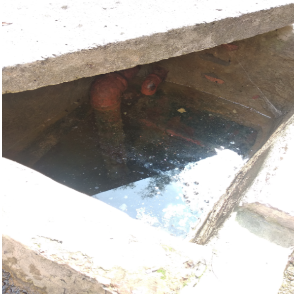
Fotografía 5. Estado interior aljibe aj-01-0095.