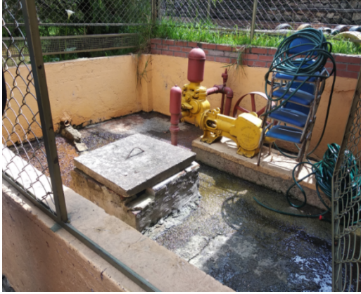
Fotografía 3. Vista general del área de ubicación del aljibe con código aj-01-0095.