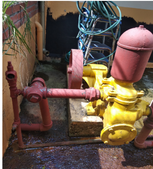
Fotografía 6. Vista bomba fuera de servicio