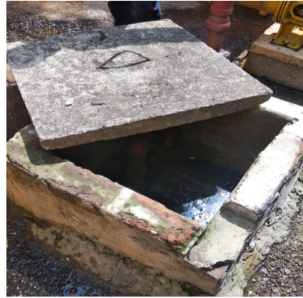
Fotografía 4. Estado exterior aljibe aj-01-0095.