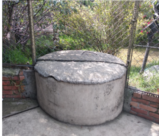
Fotografía 8. Vista ubicación aljibe aj-01-0096 que alimenta el lago